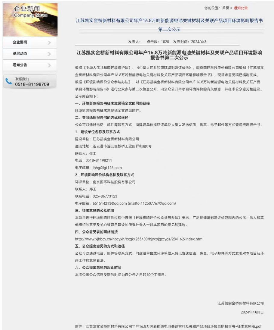
图 3.2-1 第二次网络公示截图