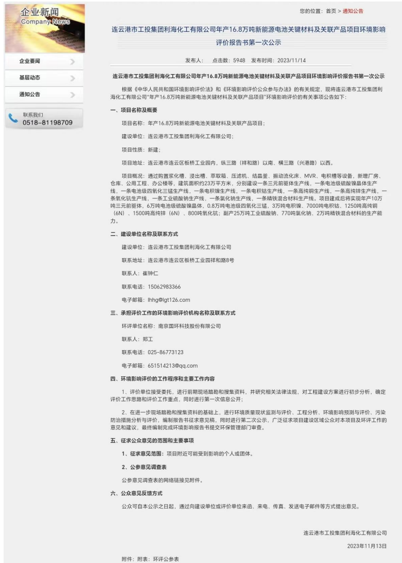
图 2.2-1 第一次网络公示截图

首次环境影响评价信息采用网络公示，公示网站为江苏凯实金桥新材料有限公司官网，网站对外公开，因此，本项目首次环境影响评价信息公示选取的网络平台符合相关要求。公示网址： http://www.lygsgtlh.cn/NewsView.asp?ID=352&SortID=3 ，首次公示网页截图见图2.2-1。